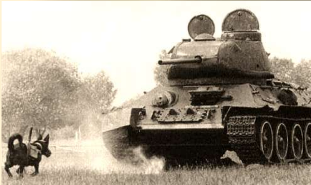
Собаки с взрывчаткой. готовые взорвать танк.