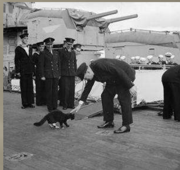
Кошек брали на борт субмарин в качестве живых детекторов качества воздуха.