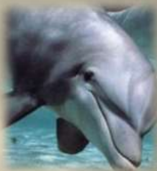
Дельфины и котики