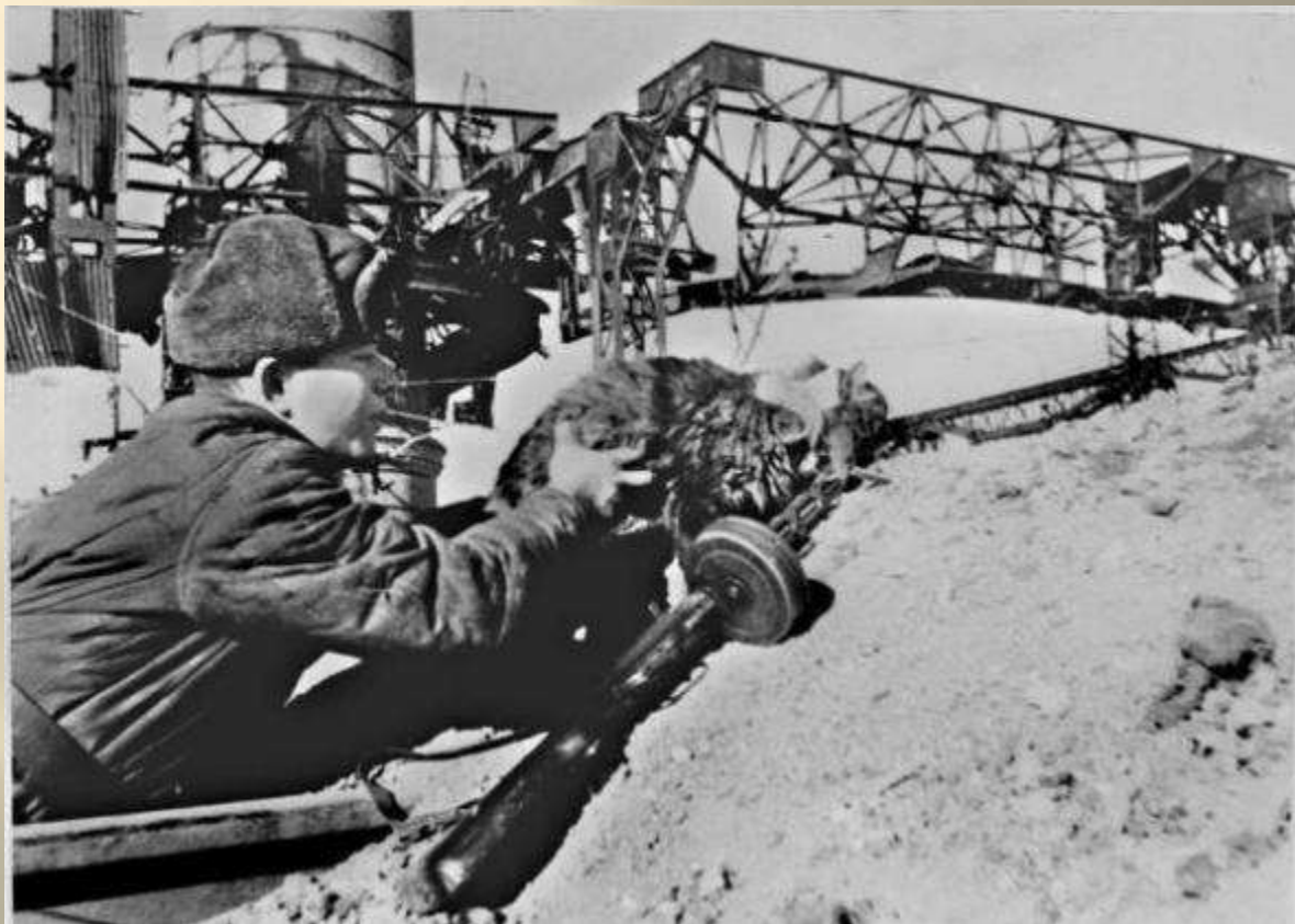
КОТ, ХОДИВШИЙ С ЛИСТОВКАМИ В ФАШИСТСКИЕ ОКОПЫ. СТАЛИНГРАД. ЯНВАРЬ 1943г.