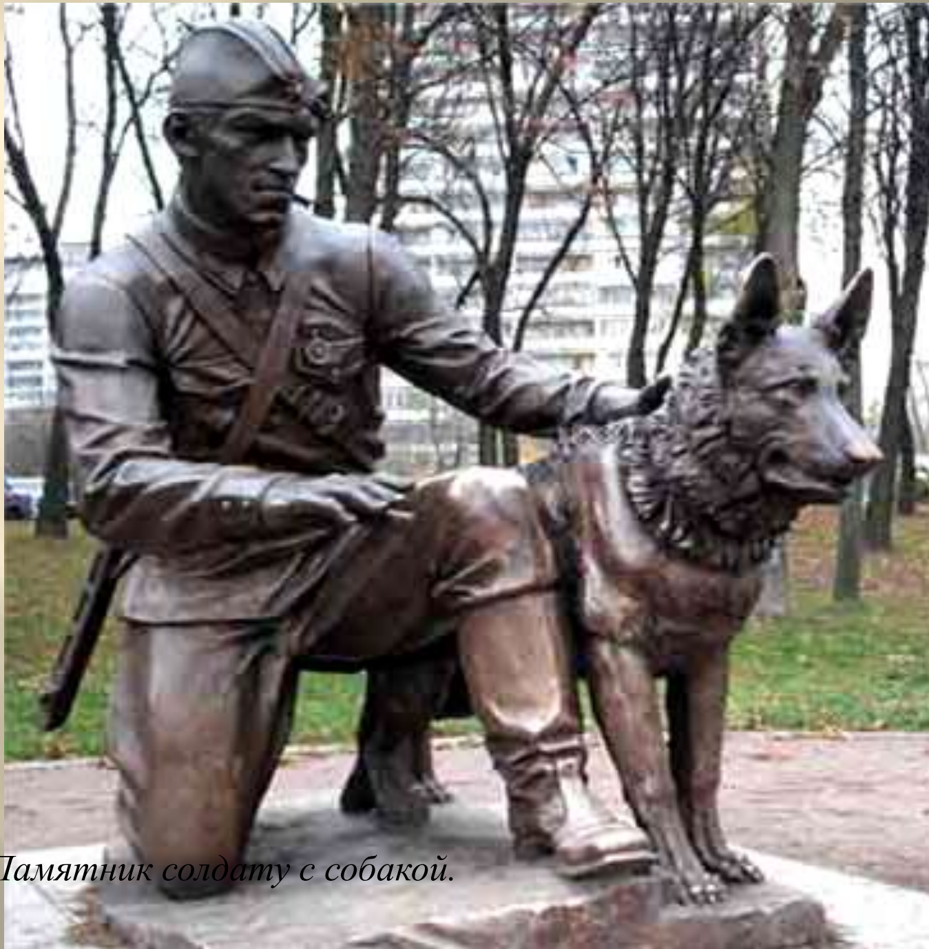
Памятник солдату с собакой.