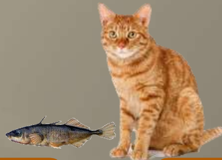
Кошка и колюшка