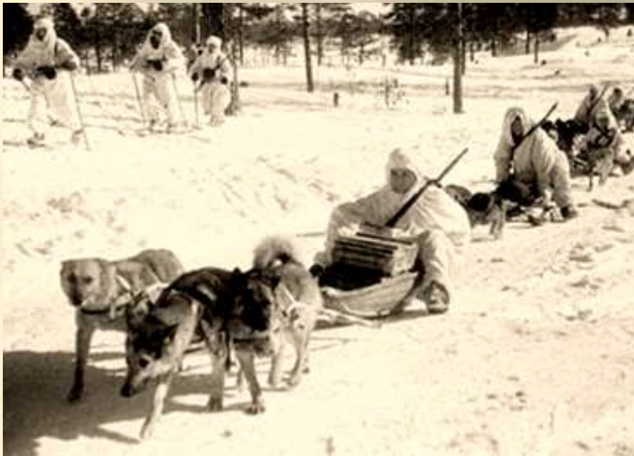
Упряжки с собаками, перевозящие снаряжение.