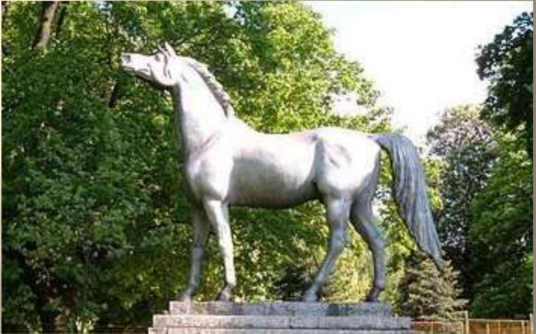
Памятник лошадям, погибшим в войну.