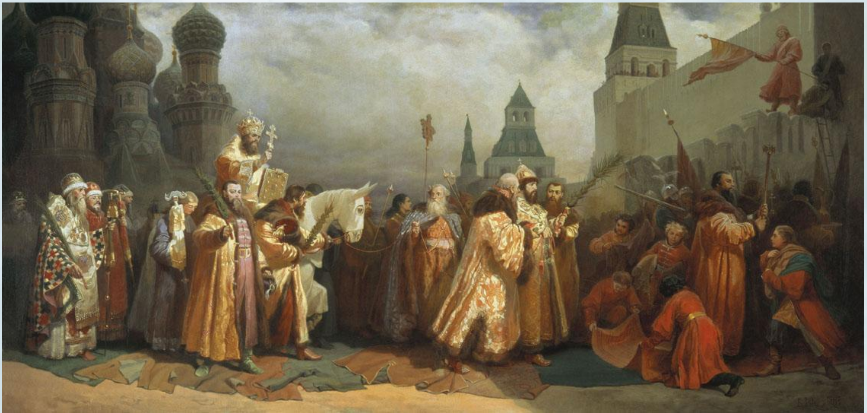
В. Г. Шварц «Шествие на осляти Алексея Михайловича» 1865.

На Руси в праздник Входа Господня в Иерусалим совершалось так называемое «шествие на осляти».