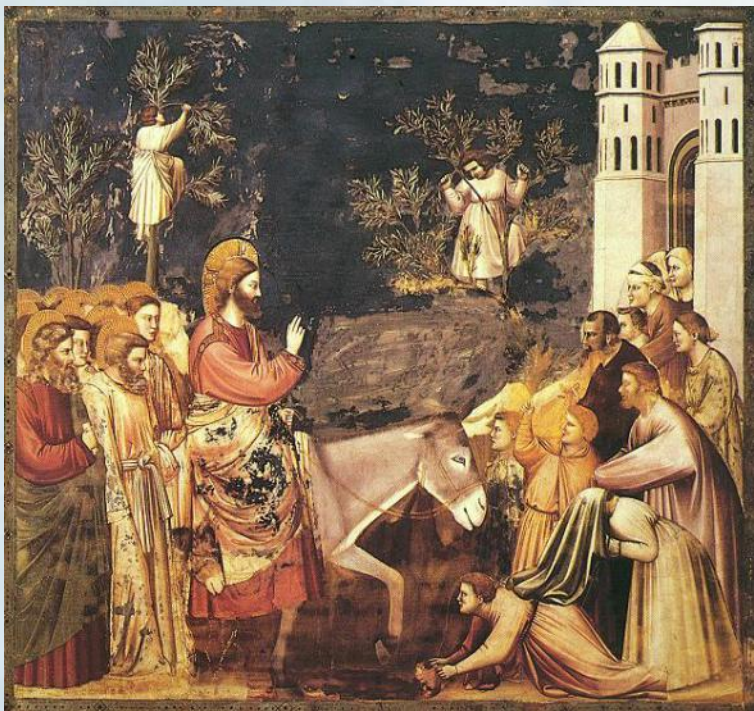
Джотто. Вход Господень в Иерусалим

Согласно Библии, В ЭТОТ день Иисус на молодом осле – символе кротости и миролюбия – торжественно въехал в ворота Иерусалима.